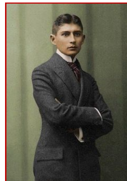
Κ. Μπαλάσκα, Μάνα μου Ελλάς

→ NEO: Το Τμήμα της Νότιας και Κεντρικής Ευρώπης και της Μέσης Ανατολής της International Society for Cultural-Historical and Activity Research ( ISCAR ), το Τμήμα Ψυχολογίας και το Τμήμα Προσχολικής Εκπαίδευσης του Πανεπιστημίου Κρήτης και το Τμήμα Προσχολικής Εκπαίδευσης διοργανώνουν διεθνές συνέδριο με τίτλο «Η Πολιτισμική-ιστορική και Κοινωνικοπολιτισμική Έρευνα στην Εποχή της Σύγχρονης Κρίσης: Συνεπαγωγές στην Εκπαίδευση και την Ανθρώπινη Ανάπτυξη», Ρέθυμνο, 18-19 Ιουνίου 2016